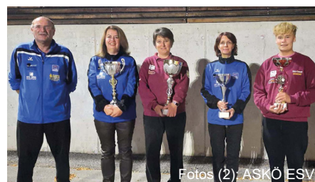
Sieger des Herren-, Damen- und Nachwuchsbewerbes.